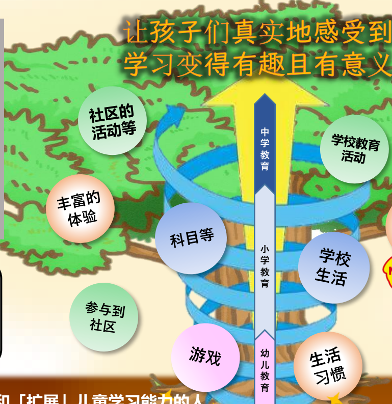
来自令和7年度全国学习能力·学习情况调查结果