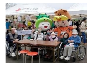
ちゃちゃもふっきー