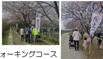
ウォーキングコース