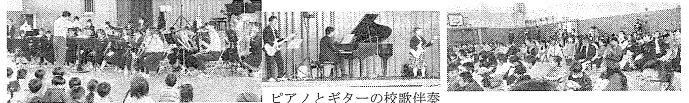
ピアノとギターの校歌伴奏

松ヶ崎小と米ノ庄小が統合し、4月に開校した「よねのしょう小学校」の開校記念イベントを開催。児童や保護者、統合2校の地域住民ら約400人が来場し、イベントを通して交流し合って開校を祝いました。