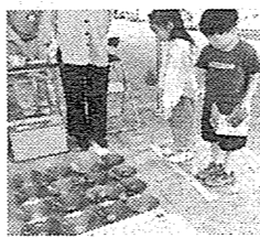
カッピンカッピン↑