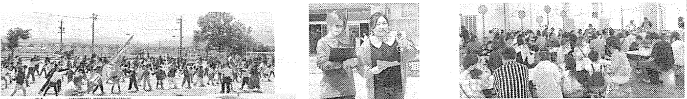
260食のカレーライス(昼食)