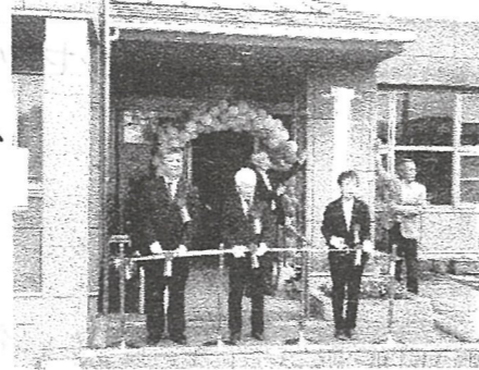
鵜住民自治協議会、役員、コミュニティセンター事務局職員一同

皆様には、日頃より鵜住民自治協議会にご理解とご協力を賜りありがとうございます。4月1日より「鵜公民館」が「鵜地区コミュニティセンター」に名称が変わりました。また、鵜住民自治協議会がセンターの指定管理者に認定され、管理、運営を行うことになりました。「地域住民、利用者が主人公」をモットーに「集う、学ぶ、つなぐ」を担う生涯学習の拠点として身近な学びの場となるよう努めていきます。名称や形は変われども、学びの力で地域を元気にしていくという目的は一つです。「地域における学びの場」「人々が集い交流する場」としての役割は決して変わりません。新体制になりましても、これまでと変わらぬお力添え賜りますようお願いいたします。