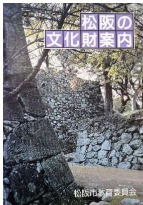
平成 2 年(1990)3 月