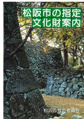
平成 18 年(2006)3 月