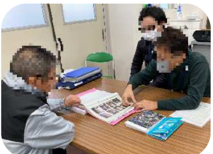
「空き家相談会」の様子