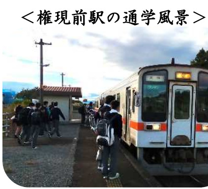
< 権現前駅の通学風景 >

JR名松線は、松阪駅と伊勢奥津駅をつなぐ地域の公共交通機関として広く利用されており、その歴史は古く今年で開通88周年を迎えます。しかしながら、沿線地域の人口減少やマイカーでの移動など、取り巻く環境は年々厳しくなっています。