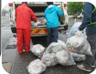
◀集まったごみを収集車へ