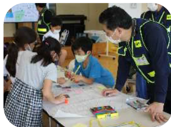
タウンウォッチングの様子

児童たちは地域の方々と一緒に嬉野上野町内を散策し、学校に戻ってから「地域安全マップ」を作成しました。作成したマップをクラスで発表し、地域安全力を高めました。