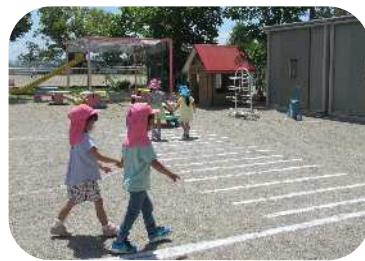
左右を確認して横断歩道を渡ります