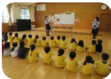
交通安全教室の様子