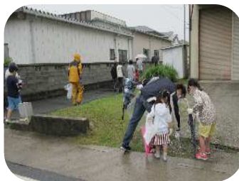
▶みんなで清掃活動