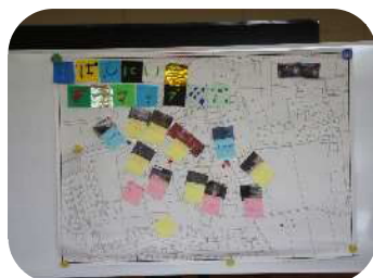
作成した地域安全マップ