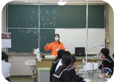
身近な福祉についての授業