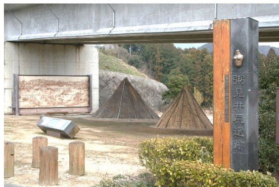
粥見井尻遺跡 - 三重県指定史跡 (飯南町粥見)

松阪市内で もっと 最も古い人間の生活の跡がみつかったのは、 いいなん かゆみ いじり 飯南町粥見の粥見井尻遺跡です。平成8(1996)年に実施された発掘調査では、縄文時代 そうそうき 草創期(15,000年~12,000年前)の たてあな 竪穴建物4棟と土坑16基が確認され、草創期の特徴をよく示す土器や石器が多数出土しました。草創期の建物跡や遺物がみつかるとは珍しく、当時の集落の様子を知ることができる学術的に価値の高い遺跡です。とりわけ大きな発見は、竪穴建物を埋めていた土の中から2点の土偶(うち1点が三重県指定有形文化財)が出土したことです。