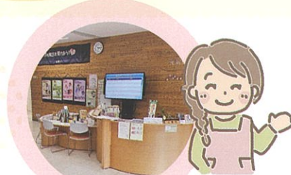
はるるコンシェルジュ