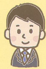
ケースワーカー、 保育士、教員など

家庭の困りごと、こども の悩み(本人、家族 も含む)についてご相 談ください。 必要時には他機関と も連携します。