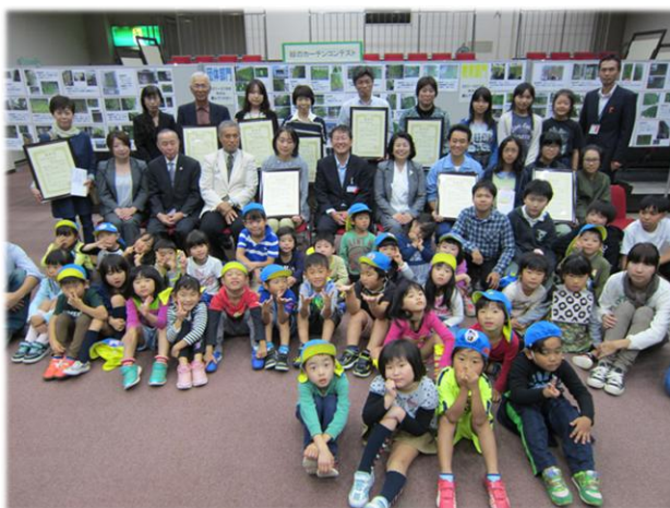
《平成27年度 緑のカーテンコンテスト表彰式》