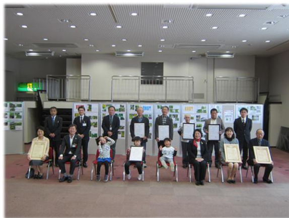
【団体部門】最優秀賞 第二公民館