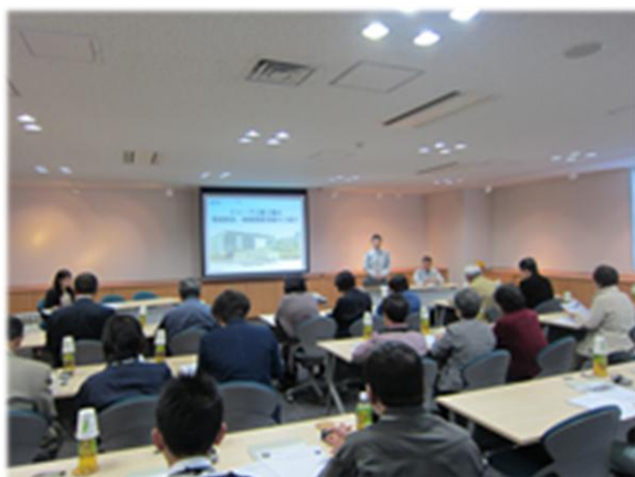
シャープディスプレイテクノロジー株式会社 三重事業所にて