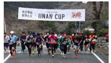
第59回大会の様子(令和7年2月2日)

【申込方法】12月1日(月)午前9時から12月25日(木)午後4時半までに、 申請フォームからお申し込みください。