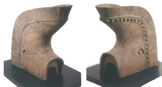
釜生田辻垣内瓦窯出土(嬉野釜生田町) 国指定重要文化財

また、中村川の河川改修では、瓦窯の跡が嬉野釜生田町で見つかり、辻垣内瓦窯として知られています。ここでは、寺院の大屋根の両側に飾られた靴のような形をした鴟尾(しび)と呼ばれるものが見つかり、国の重要文化財に指定されています。この鴟尾も、同じく嬉野ふるさと会館考古館で見学することができます。