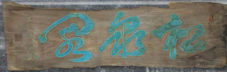
高林五峯筆 松泉閣看板

松泉閣は松阪市殿町の松坂城跡南側に大正12年(1923)に建てられた料理旅館です。現在建物は残っていませんが、令和5年(2023)で築後100年を迎えました。