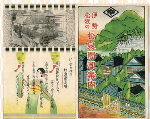
松泉閣御案内パンフレット(部分)