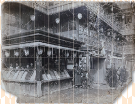
浅草「常盤堂雷おこし」建物写真(大正期)