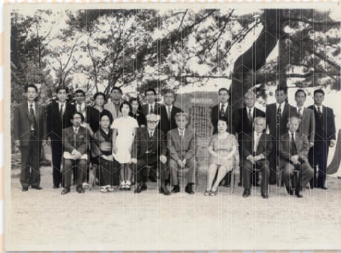
梶井基次郎文学碑建設記念写真(個人蔵)