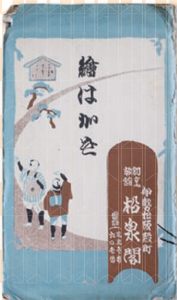
松泉閣絵はがき外袋