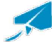
当社のシンボルマーク紙飛行機

総合印刷会社である当社は、110年を超える印刷技術の粋を超え、社会に向けた新たな価値を創造する企業へと変革するため「人と人、人と社会、そして社会と社会を結ぶコミュニケーション企業」としてトップを目指す意味を込めて、2020年10月1日より社名を変更しました。