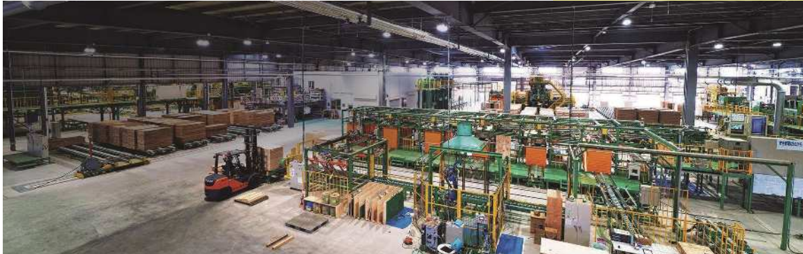
三重工場の全体写真です

株式会社日新は、操業75年以上の日新グループにおいて合板製造・販売の中心を担う企業です。中でも三重工場は2018年に操業開始した紀伊半島初の合板工場となります。合板とは、建物の屋根・壁・床など様々なところに使われる建築に欠かせない木質材料です。私たちは100%三重県の木で、100%三重県の社員によって高品質な合板を製造し、全国のお客様のお役に立つとともに地域に貢献する企業を目指しています。