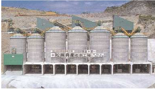
佐奈工場（砕石工場）