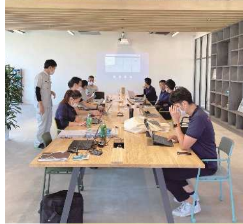
ミエラボでのワーク風景

当社は1956年の創業以来、「安心・安全・快適」をキーワードに事業展開し、工場や作業現場で使用者の手を守る作業用手袋「ミエローブ」、洋菓子の持ち運びや精肉・魚介類の配送に欠かせない保冷剤「スノーパック」、頭や身体を冷やし快適にする「保冷具」のほか、整形外科などで患部を温め治療する「ホットパック-mie」や、医療・看護現場との共同開発により生まれた「アイシングフィット」「くるっとクール」などの医療機器を提供しています。