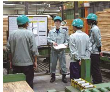
社員一丸となって合板製造に取り組んでいます

株式会社日新は、操業75年以上の日新グループにおいて合板製造・販売の中心を担う企業です。中でも三重工場は2018年に操業開始した紀伊半島初の合板工場となります。合板とは、建物の屋根・壁・床など様々なところに使われる建築に欠かせない木質材料です。私たちは100%三重県の木で、100%三重県の社員によって高品質な合板を製造し、全国のお客様のお役に立つとともに地域に貢献する企業を目指しています。