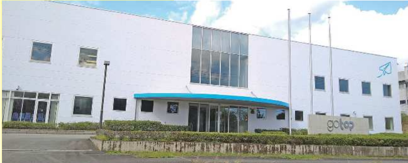
「印刷産業環境優良工場」に認定された本社工場