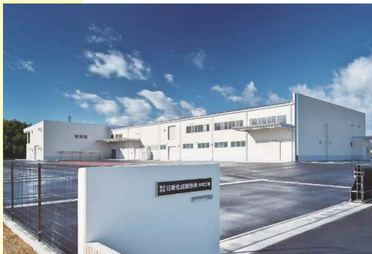
㈱日新化成製作所 多気工場

当社は、お客様に最大の満足と誠意を贈り、地域社会への奉仕を心がける事を基本理念とした会社です。