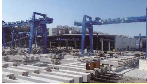
播磨工場（建築工用Pca工場）

貴方の街を思い浮かべてください。街には家々が立ち並び、舗装された道路、その脇を流れる水路、役所や学校や病院、ビル、コンビニ、ショッピングセンター、駅、高速道路。また、郊外に目を向ければ美しく広がる田園風景と清らかな川の流れ…ありふれた日常の風景が思い浮かぶことでしょう。