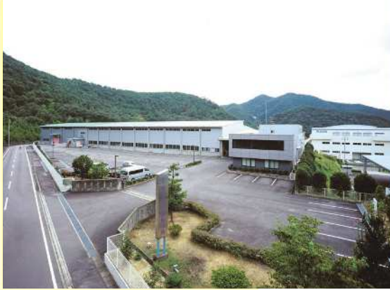
本社工場（岐阜県各務原市）