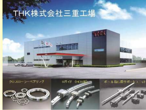
三重工場 事務棟の全景と主力製品

「世にない新しいものを提案し、世に新しい風を吹き込み、豊かな社会作りに貢献する」・・・を経営理念とし、メカトロニクス産業に不可欠な機械要素部品の製造・販売。NC工作機械、産業用ロボット、半導体製造装置等々に必要不可欠な『直動システム』を世界に先駆けて開発した創造開発型企業です。