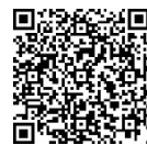
松阪市ゼロカーボンシティ宣言