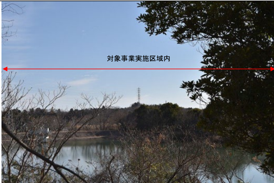
落葉期：令和4年1月27日