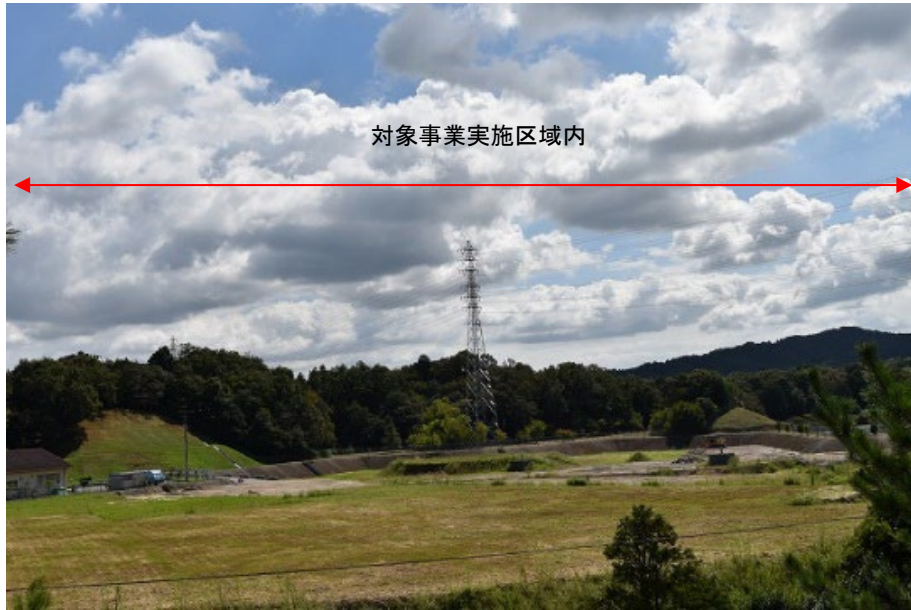
着葉期：令和3年9月20日