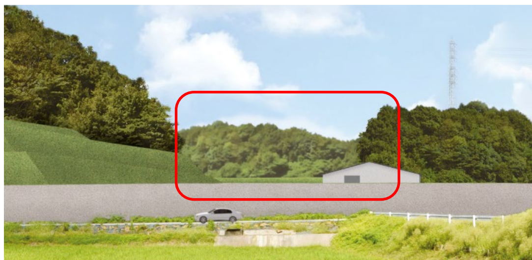
第 1 期完了時