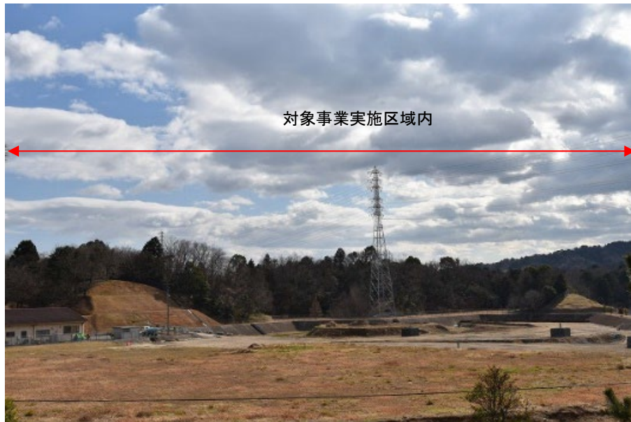
落葉期：令和4年1月27日