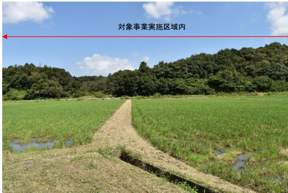
着葉期：令和3年9月20日