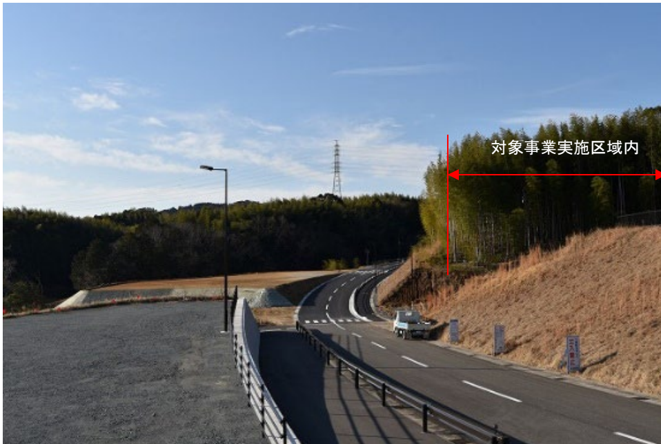
落葉期：令和4年1月27日