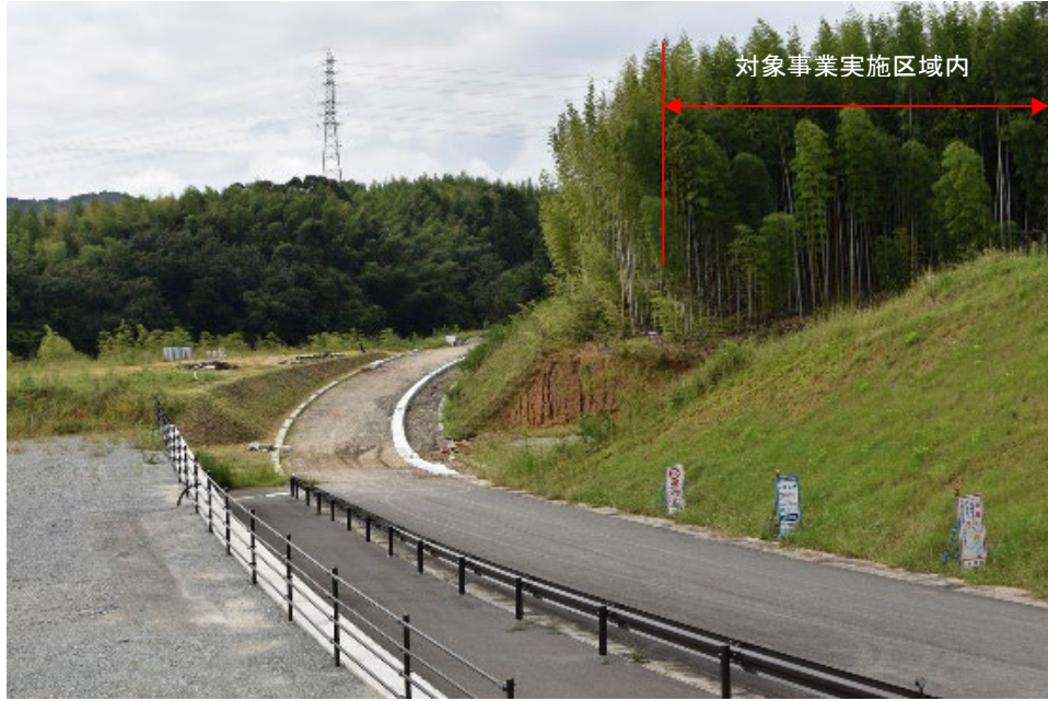
着葉期：令和3年9月20日