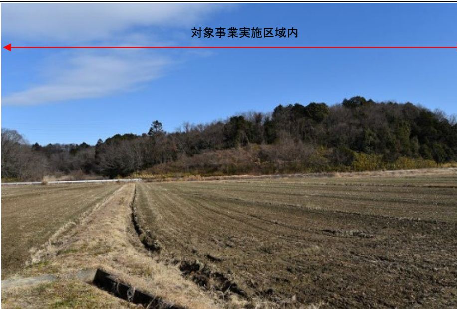
落葉期：令和4年1月27日