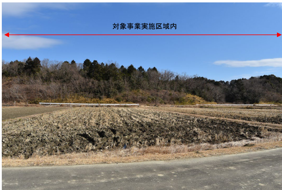
落葉期：令和4年1月27日