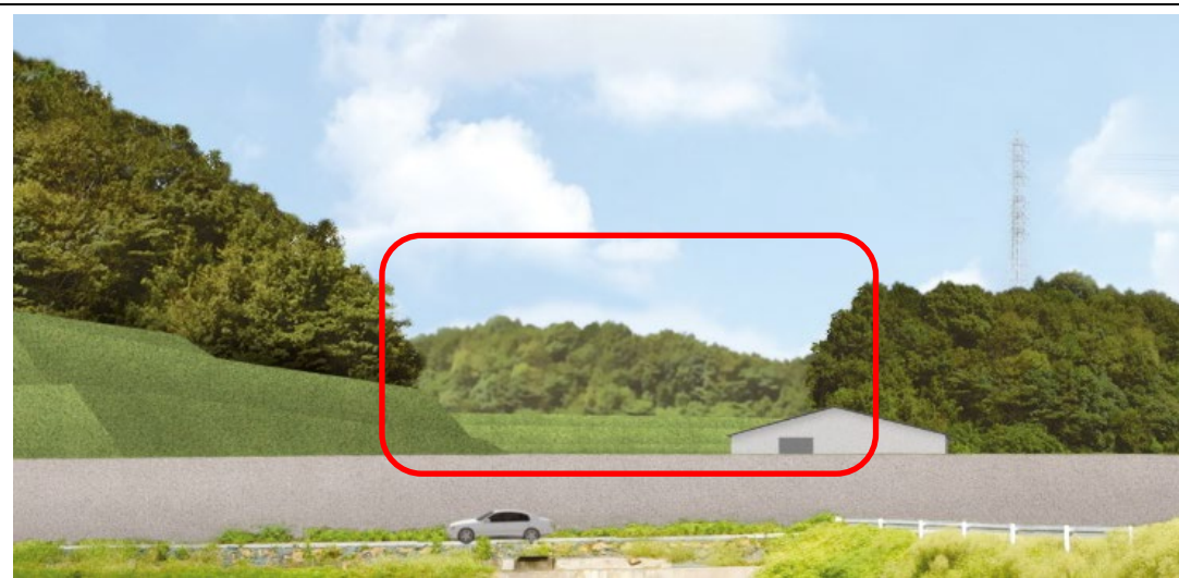
第 3 期完了時