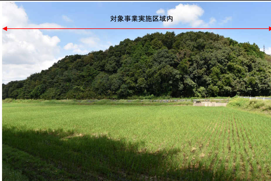
表 7-14-1.4(4) 眺望景観の状況（対象事業実施区域南側1）