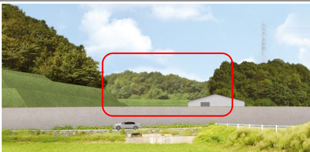
第 2 期完了時