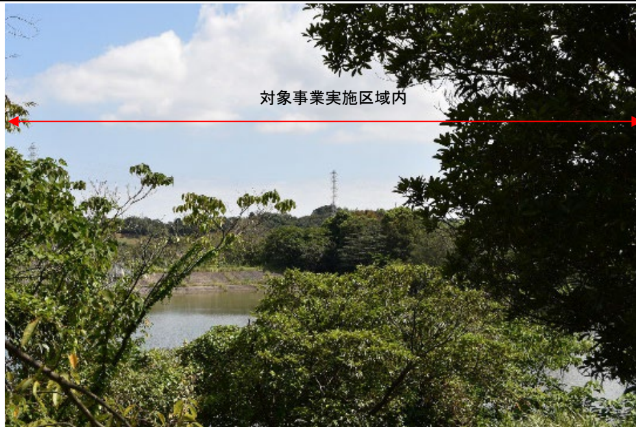
着葉期：令和3年9月20日