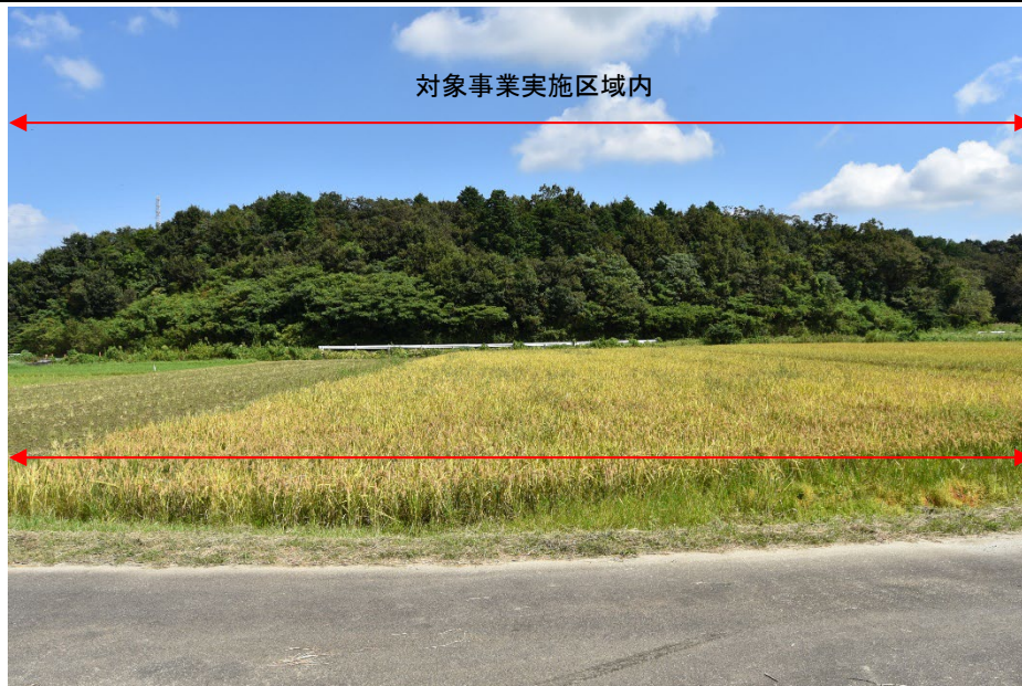
着葉期：令和3年9月20日