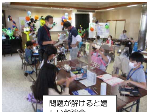
問題が解けると嬉しい勉強会