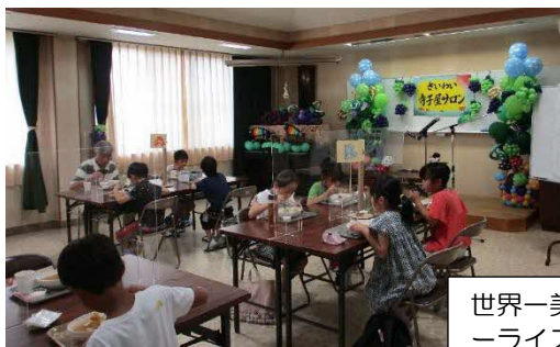
世界一美味しいと評判のカレーライスとデザートで昼食会