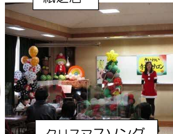
クリスマスソング