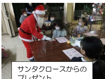
サンタクロースからのプレゼント