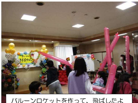
バルーンロケットを作って、飛ばしたよ