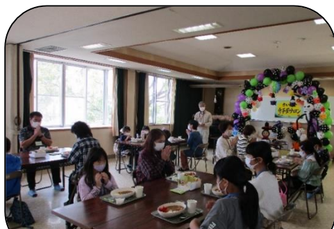
世界一美味しいと好評のカレーライス