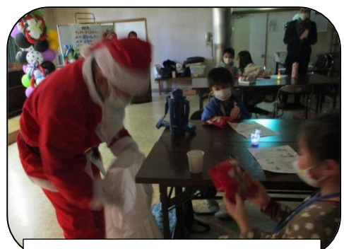
サンタクロースがやってきた