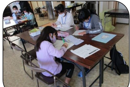
一生懸命に問題を解く小中学生