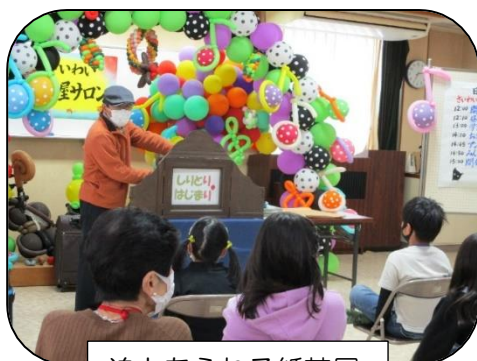
迫力あふれる紙芝居