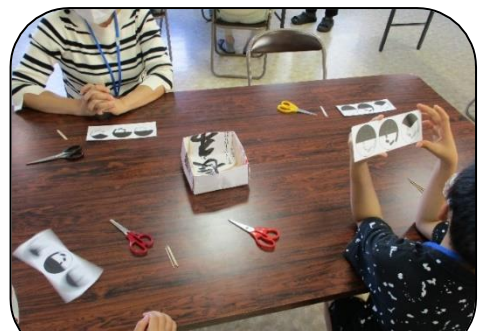
不思議なベンハムのこまを作ったよ