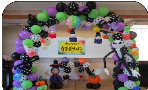
今日はどんなバルーンのお土産かな？