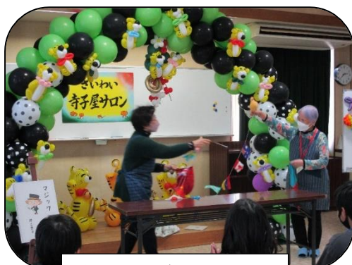
楽しいマジックショー