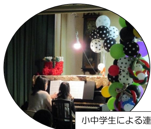
小中学生による連弾