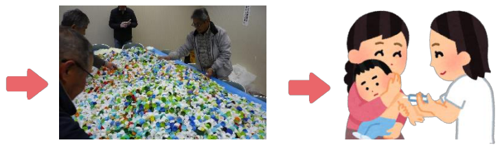
回収後エコ・ワクチン協会へ

皆様から回収させていただいたエコキャップは各自治会長様が年に3回嬉野中川まちづくり協議会に持ち込んでいただいております。