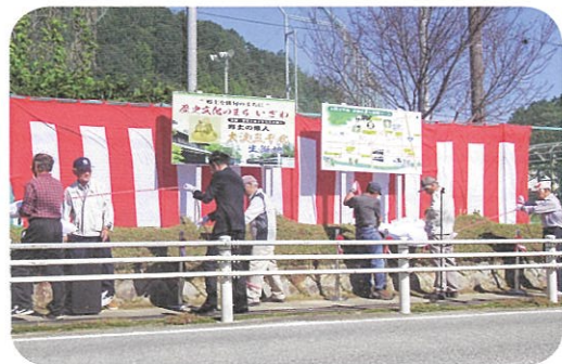
【大型看板の除幕式】