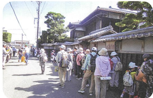
【句碑めぐりウォーキング】