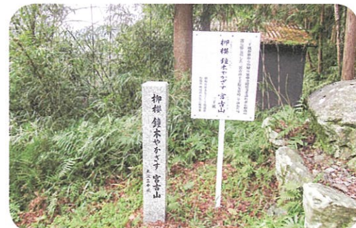
【三千風句碑・説明看板】