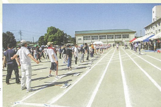
【運動会&地区体育祭】