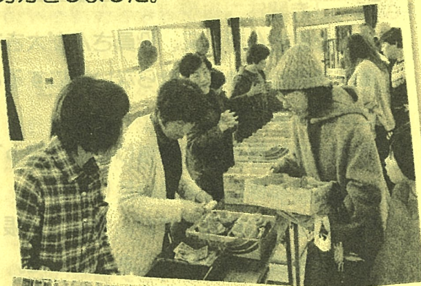
収穫したジャガイモはお祭りでも販売しました。