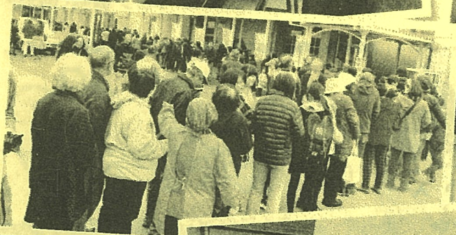
特産のイチゴを求めて地域内外から多くの人々が来場しました！

はたどの祭り恒例の餅まきの様子。安全性や不公平感をなくすために世代別で実施しています。