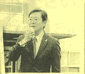
市長にもご挨拶いただきました。