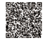
バーコード読み取り (文化財センター情報)

スタンプラリー 1/13(土)~1/14(日)9:00~16:00 ※すべてのスタンプを集めるとシールがもらえます