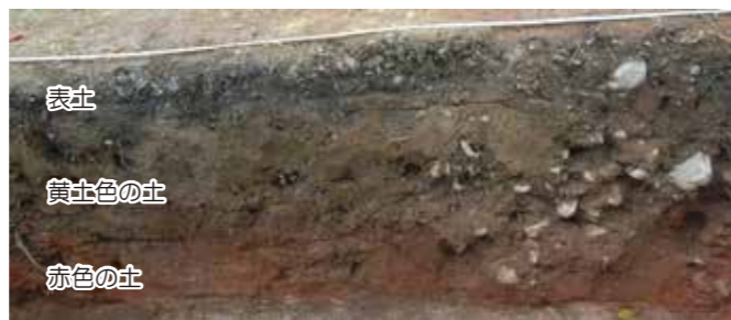
写真1 トレンチ1土層断面

トレンチ1の土層の断面を調べると、上部の土の色は黄土色で、下部の土の色は赤色でした。また、黄土色の土には、多数の瓦片や陶磁器片が混ざっていました。これらのことから、調査箇所の石垣は、一度築かれた後に改変を受けていることが考えられます。