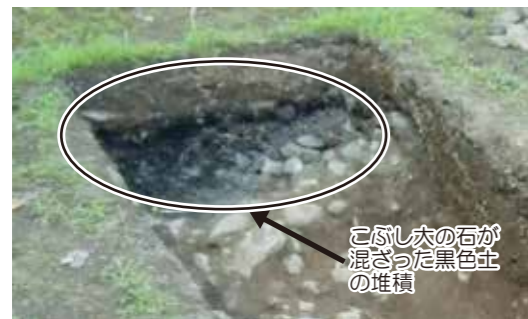
写真2 トレンチ1北端部

トレンチ1の北端に、こぶし大の石が混ざった黒色土が集中して堆積していました。松坂大火(1)の際に生じた大量のがれきを松坂城跡に埋めたという話が伝わっており、もしかすると、今回見つかった黒色土はその伝聞を裏付けるものかも知れません。