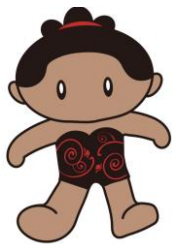
天白遺跡マスコットキャラクター