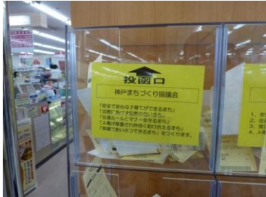
マックスバリュー学園前店