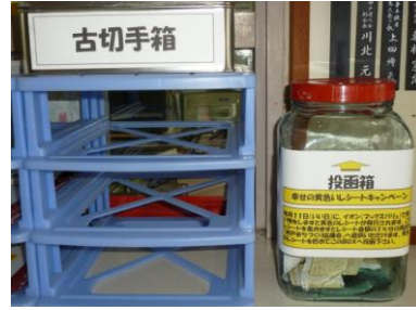
神戸地区市民センター受付