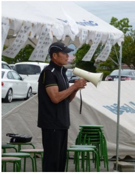
畦地公民館運営委員長