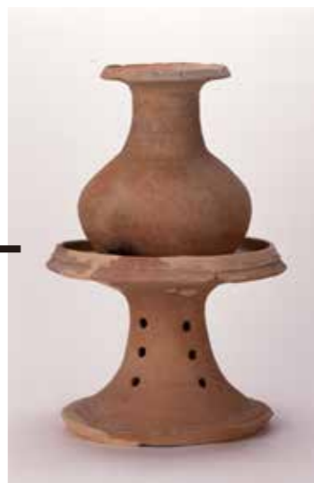
写真3 壺と器台（倉敷市上東遺跡）