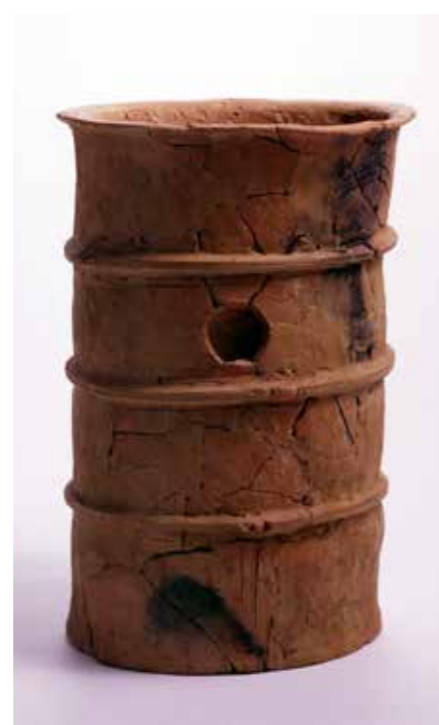
写真1 円筒埴輪（松阪市宝塚1号墳）

下の写真1の円筒埴輪を見てください。筒のような形をしていて、3本の粘土の帯（突帯）がその胴体に巻かれていることがわかります。また、1段目と2段目の突帯の間に丸い穴もあけられていますね。