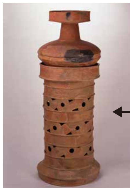
写真2 特殊器台と特殊壺（新見市西江遺跡）

弥生時代後期になると、各地に墳丘墓と呼ばれるその地域の首長を埋葬した大きなお墓がつくられるようになりました。墳丘墓からは、様々な土器が見つかりますが、特に弥生時代末の吉備地方の墳丘墓からは、特殊壺とそれをのせる特殊器台（写真2・右上）と呼ばれる物が見つかっています。これらの土器は、それ以前から使われていた壺とそれをのせる器台（写真3・右上）から変化したもので、葬