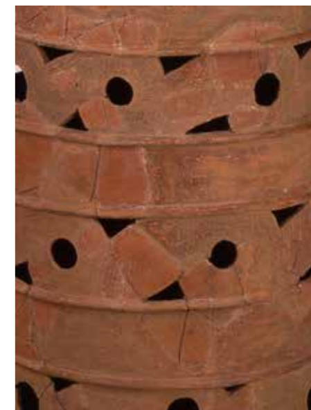
写真4 写真2の特殊器台の一部を抜粋し拡大

に使用された特別な土器であると言われています。ここで、写真2の特殊器台に注目してください。形が円筒埴輪に似ていると思いませんか？ 実は、この特殊器台こそが円筒埴輪の起源となったものと考えられているのです。