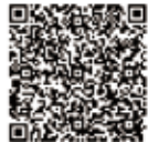
バーコード読み取り (文化財センター情報)

6月の休館日は5日(月)、12日(月)、19日(月)、26日(月)です。 開館時間は9:00～17:00です。