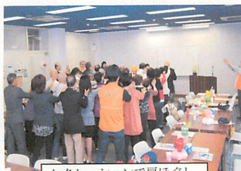
レクリエーションで肩ほぐし