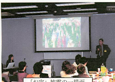
「お宝」披露の一場面