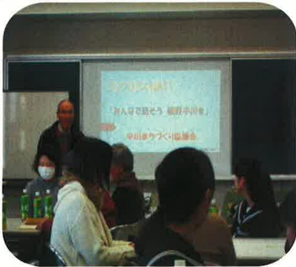
話し合いのテーマ説明