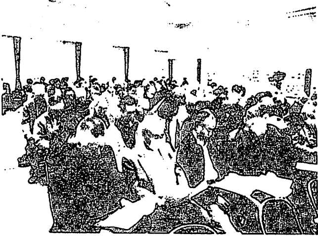
熱心に審議に参加いただいた代議員の皆様