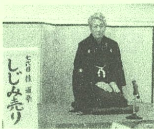
七代目桂 道楽 しじみ売り