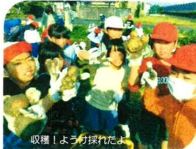
収穫！ようけ採れたよ

収穫したじゃがいもで、ポテトサラダを作りました。 地域の皆さんが教えてくれました。