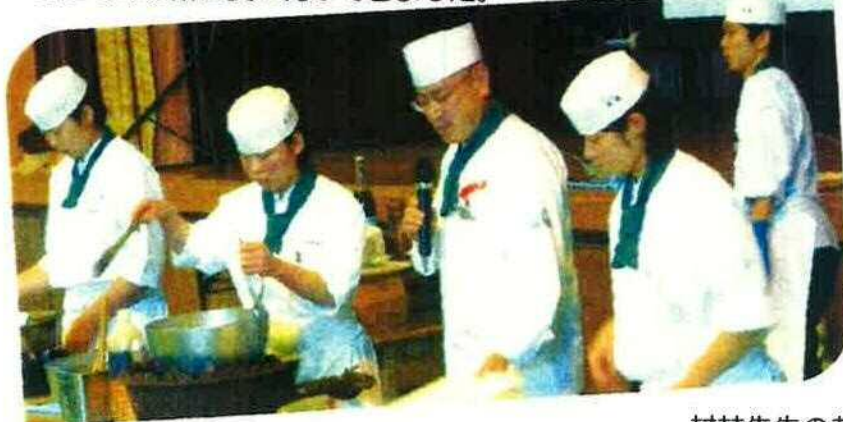
村林先生のお話は、楽しくてためになります。