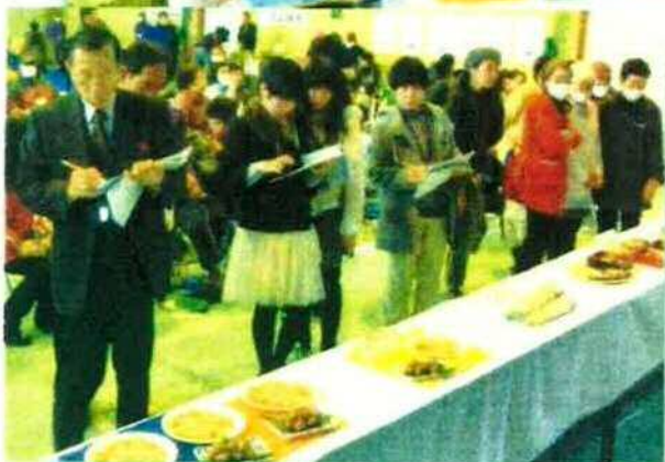
真剣に審査中。 どれも美味しいなあ・・・。