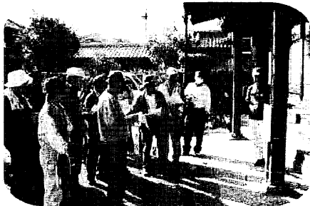
ポイントで問題に挑戦の参加者