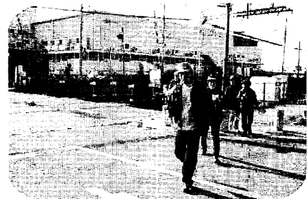
自分たちのペースで歩く皆さん