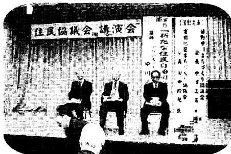
基調講演者及び発表者