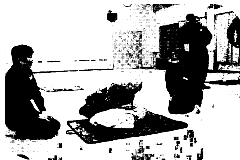
胸部圧迫による蘇生講習