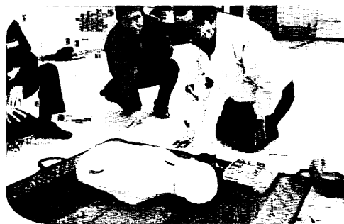
AEDを使用した蘇生講習

2月6日（日）中川コミュニティセンターで松阪北消防署から7名が講師としてきていただき約3時間、心臓や呼吸が突然止まった人の命を救うにはどうすればよいかについて講習を受けました。受講内容は、救急車が到着するまで心臓や呼吸心肺蘇生法の胸部マッサージと人口呼吸及びAEDによる電気ショック使用などを参加者全員が実際に行いました。