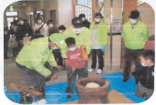
楽しく・一生懸命に餅を搗く子ども達

3歳児から5歳児の子どもを対象にした恒例の餅つき大会が、1月20日（日）に中川コミュニティセンターで開催されました。5歳児は、臼の中にある蒸し上がったもち米を小搗してもらって、順番にまちづくり協議会のスタッフの手助けをうけながら杵で搗き始めました。その顔は真剣そのもので、体験が終わったあとでは満足した顔にかわっていました。保護者の方は子どもの搗く姿をカメラにおさめていました。