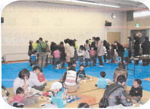
つきたての餅を戴きます