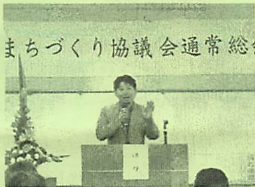
山中 光茂 市長

みんなに喜んでもらえるか、満足していただけるか熱心に検討してくれているのです。このような善意のスタッフの支えによって、まちづくり協議会の活動は支えられているのです。