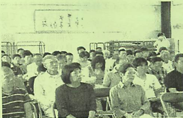
総代会出席者の皆さん

当会に、関わって頂いても生活は、楽にはなりません。みんなで持てる力を出し合い、企画に参加していただくと世の中が見えてくる事は、間違いのないようです。今年も、みなさんに支えていただき、頑張っていきたいと思っておりますので、よろしくお願いいたします。