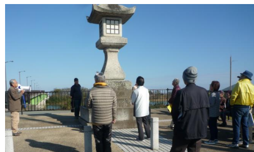
小野江常夜燈の説明