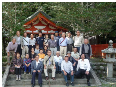
北畠神社の正殿前で記念撮影