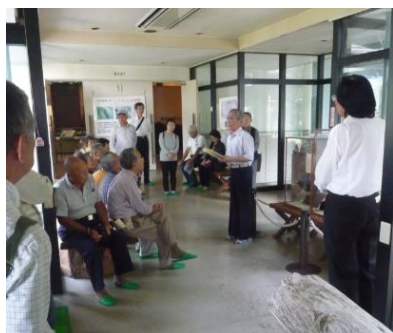
美杉ふるさと資料館で説明

10 月 6 日(木)に研修会が開催され、28 名の方が参加されました。今回は津市一志町と美杉町歴史と文化に触れ展示や歴史の語り部としての技を学ぶことを目的に開催されました。三重中央農協の郷土資料館では、高野製糸工場のミニチュア版や、生活用具、農林業の道具について展示されていました。