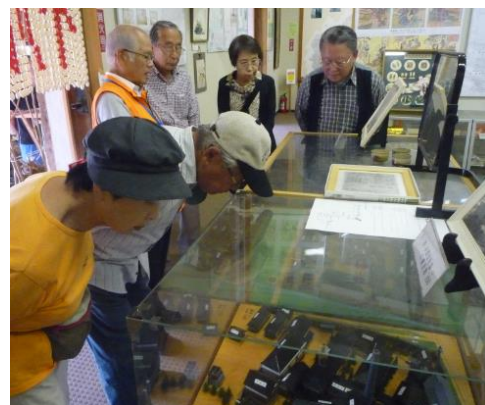
高野製糸工場のミニチュア