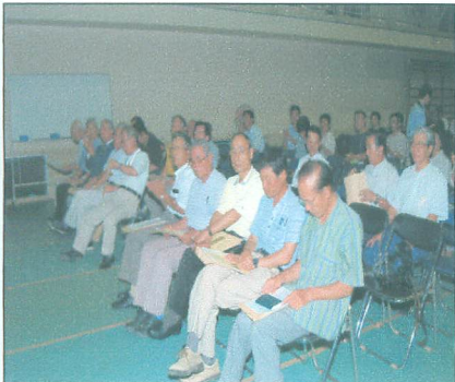
↑東部管内からの来賓の方々