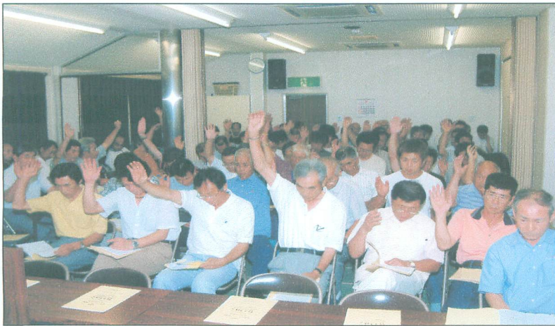
↑平成 18 年 7 月 26 日 設立総会の採決の会場 ↓式典の様子↑