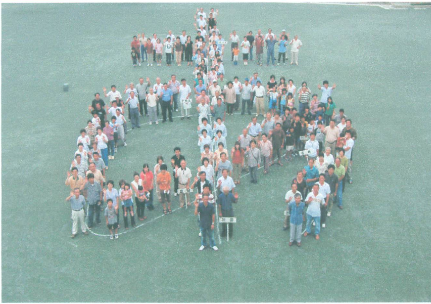
平成 18 年 7 月 23 日 (日) 14 : 00 朝見小学校校庭 撮影

平成十八年七月二十三日午後二時より人文字撮影。当日は今にも雨が降りそうな天候であったが設立記念シートに載せる、人文字撮影に各町より参加した。人文字は朝見の「あ」を参加者全員が文字の形に整列して行われた。記念撮影には一人でも多くの人が参加出来るよう、チラシ、回覧、放送等呼びかけた中、二百余人の方が参加した。このシートは朝見まちづくり協議会設立の記念品として、全戸配布され価値ある記念品となった。