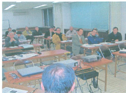
↑飯南まちづくり検討委員会の質疑応答。

平成19年12月21日飯南居コミュニティセンターにて、16時より地域振興局職員の方に、19時よりまちづくり検討委員会の方に朝見の活動を紹介。