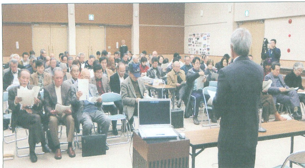
上下 第一部で活動報告を行う代表者の方々（第一部）

伊賀市東部地域住民自治協議会の紹介 上野市域下町東部地域に位置し、伊賀街道沿いに広がる田園地帯 15町 16自治会で構成される。地域内には小学校2中学校2の校区があり、伊賀市では、すばぬけて大きな住民協議会です。平成16年市の合併に伴い、自治基本条例に基づく住民自治協議会が設立された。部会は7部会で、総務広報部会・健康福祉部会・環境保全部会・教育文化スポーツ部会・防災防犯交通安全部会・人権啓発部会・産業振興部会。各部会は10数名で構成して、活発に活動をしている。名前に「自治」を入れて、住民自らの強い意思を表している。