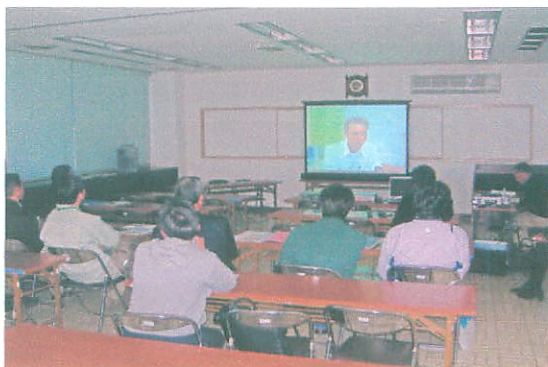
↓スライドを上映して説明をする。