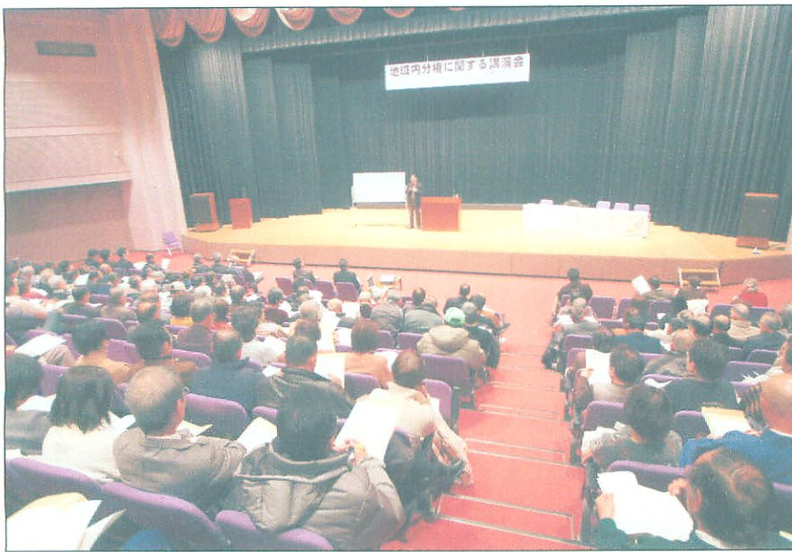
上下 地域の代表、有識者の方々約300名が参加する。(ハートプラザみその)