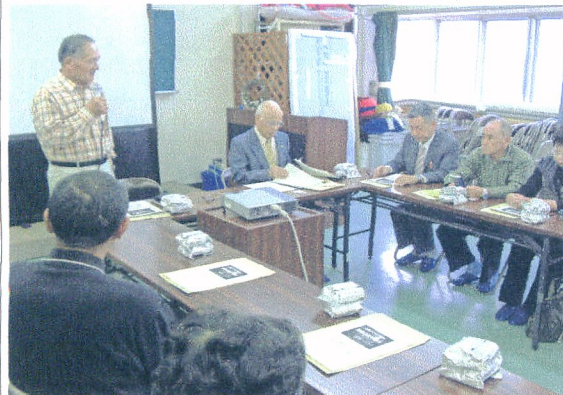
上 天白地区 下 宇気郷地区代表と交流会