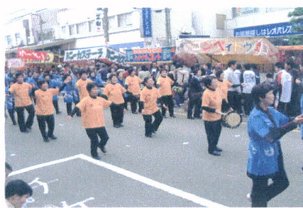
ト 氏郷まつり 下 県芸能大会に出演