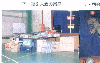
下・福引大会の景品