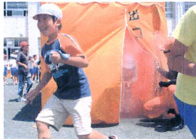
煙のトンネルをくぐり抜ける

大ごえたいかいでちよつとし こえがでなかつたけど、じぶ んではがんばつたとおもいま す。パケツリレーは水のはいつた パケツをどんどんとなりの人 にわたしていきりりでした。ち よおとつかおいはやかつたので 手がつかれませんでした。でも がんだのでうれしかったです。 しようかんれんもせんせいた ちががんばつていました。さ んかくきをぐるぐるまわって しようぼうしやのかかりのじ じにがつてやっていました。