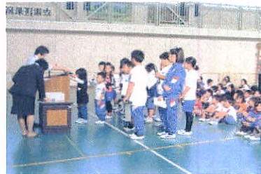
一学期終了式で表彰

きょう、ぼうさいくんれんが ありました。そのなかでじしん たいけんしやでじしんたいけん しました。ぐらぐらゆれてこわ かったです。きゅうじよへリコ プターがとんでいました。とて もかっこよかったです。ほんとう にじしんがきたらこわいです。