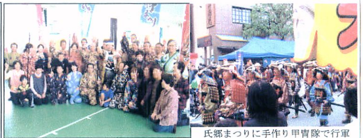
氏郷まつりに手作り甲冑隊で行軍

①平成23年度松阪牛まつりに松阪牛肉味ごはん丼とモウモウ汁で出展。②おやじの料理教室、季節のキノコを使って作る「鍋料理」でホッカホカ！ ③みんなで学ぼう、体に優しい食事 ④第5回防災講演会「一人ひとりが助かる地域に」⑤第5回防犯パトロール同乗体験をする3年生の呼びかけで地域の安心！ ⑥幸せの黄色いレシートキャンペーンで朝見に19,200円商品が還元された。