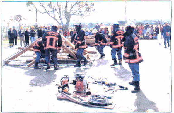
↑模範救出をする松阪南消防署員 安全正確な作業