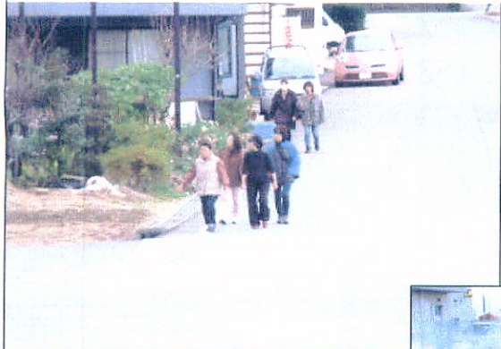
↑津波対策で徒歩避難(古井町) 松阪商業高校の前交差点