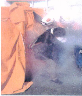
↑前が見えない!・濃煙体験