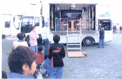
↑地震体験車 ↑消火器で消火訓練