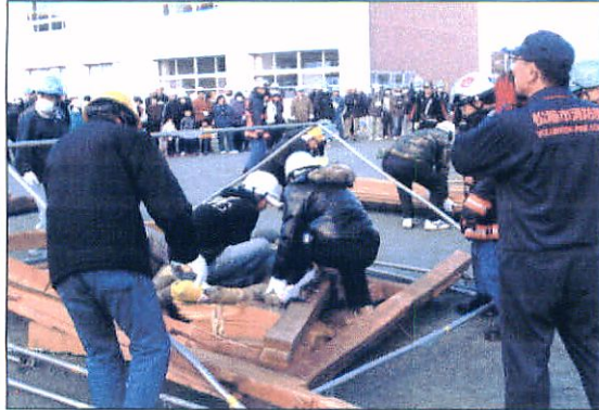
↑倒壊家屋からの救出訓練をする各町の代表