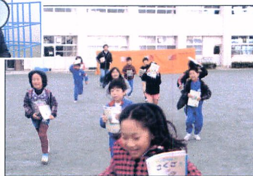
↑小学校避難訓練 ↓避難した運動場で安否確認