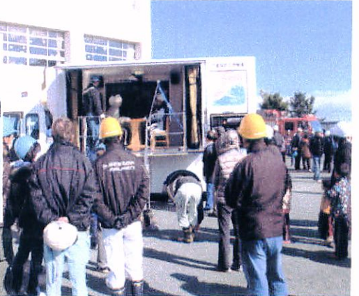
↑地震体験者の順番を待つ参加者 ↓さくらテラスまで要援護者移送訓練