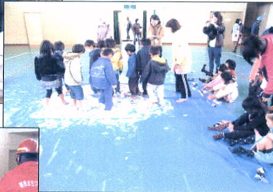
↑タマゴ殻で模擬ガレキ歩行する幼稚園児 ←大声大会・大声で叫ぶ幼稚園児 昼食を取る参加者(体育館) → 閉会式で訓練の講評を聞く↓