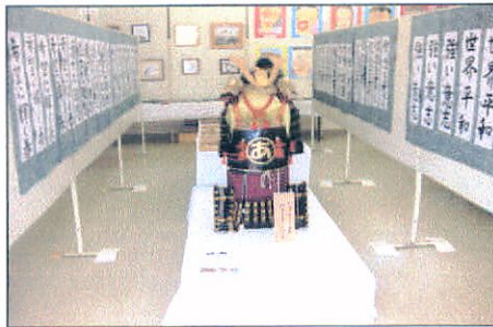
(宮前公民館文化祭に展示：宮前まちづくり会館)

平成24年3月3日〜4日飯高町の宮前まちづくり会館にて宮前公民館文化祭が開催。友好の象徴として出展の依頼がありましたので松阪市観光協会にお願いして貸し出して頂きました。住民協議会連携の形として一役買っています。平成24年度から松阪市全域43地区が住民協議会が設立します。連携の在り方は色々形態が考えられますが、共通項目や得意分野事業などが