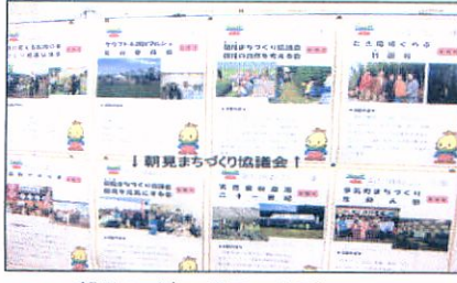
朝見のパネル展示の様子)