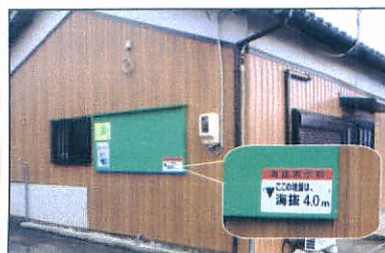
(海拔表示の例 下七見町公民館)