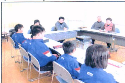
(朝見小学校児童会とまちづくりで懇談)

平成24年3月1日(木) 3:30より、朝見小学校児童会(50名)と住民協議会と「まちづくり」について意見交換を行いました。事前に、一年間の関わった事業、行事を渡してありましたので、それぞれ考えを持って参加して頂きました。夏まつりや防災訓練などに参加した意見やこれからのなどのように考えているかなどみんなで作る朝見まちづくりへ、意見