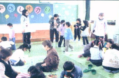
(寿会と遊びで交流する園児)

平成23年2月23日(木) 10時〜11時30分から例行事となっている寿会(朝見老人会)と園児の楽しい時間。こま返し、おたまたま、けん、五目ならべ、など昔からの遊びを一緒に楽しんだ。また、手遊びのあとにぎり手編みカゴをプレゼント。園児たちもお礼に「ごころ」の活動を披露した。地域住民が朝見っ子として幼稚園の活動に協力していきます。幼稚園児福祉施設訪問交流会しよんがいの練習、夕涼み会、昔の遊び交流会、幼稚園もちつき大会と、毎年 寿会と楽しい交流を行っています。