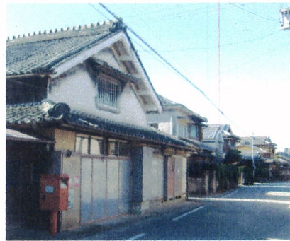
旧伊勢街道・伊賀町付近

集落へ入る所に庚甲さんと地藏堂が祭られていました。室町時代頃から講が作られ、字の講中が集まって飲食する習慣が生まれ、江戸時代には全国に広まりました。