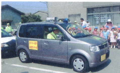
記念式終了後、園児たちに見送られて、出発する新しいパトロール車