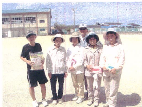
豊原Bチームの皆さん