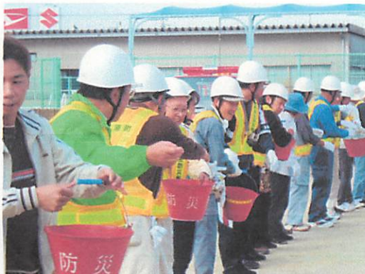
← バケツリレーの様子