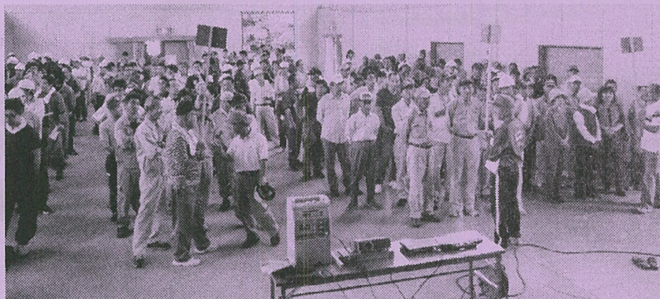
開会式をスナップ ↑

10月6日(日)、中原地区防災訓練を実施しました。朝8時からの一次避難訓練では、各自治会ごとに決められた場所に集合。中原地区全体で625名の方に参加いただき、いざというときの避難経路等を確認していただきました。9時から中原文化センターで行われた防災訓練は、3班体制で炊き出し・応急手当・パケツリレーの訓練を体験しました。米を洗わずに袋に入れて、鍋でそのまま煮る(ゆでる)炊き出しは、皆さんが興味津々。ご飯を試食して、「なかなか美味しいもんやなあ」と好評でした。