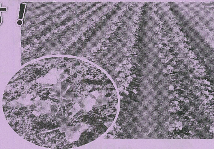
現在、なばなプロジェクトとして、地元栽培農家さんに協力をいただきながら、「三重なばな」を栽培中です。

現在、フェスティバル当日の料理コンテストに出場いただく方を、募集しています。三重なばなを使ったご家庭自慢の味や、アイデアを発揮した料理など、ご近所さん、お友だちを誘って応募してみませんか。個人や親子での応募もOKです。子どもたちもどしどし参加してくださいね。（詳しくは、同時配布の募集チラシを見てね！）