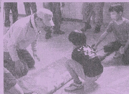
毛布を使った担架の作り方や三角巾での応急手当の方法を学びました。 →

非常袋を背負って、中原小学校の屋上まで避難。「実際の災害の時には、えらいと言わんと上るやろなあー」