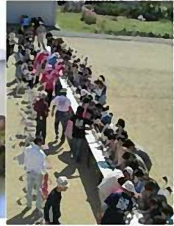
【2階から見た海苔巻きの様子】

る芸能発表会・作品展示会では、日頃の豊かな文化活動の一端を披露していただきました。相互に刺激を受け合い、和やかな雰囲気の流れが流れていきました。ご出演・ご出品いただきました皆様、ありがとうございました。