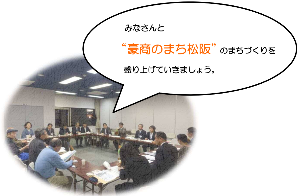
写真：松阪活き生きプラン推進委員会 会議の様子