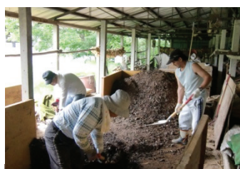
生ゴミリサイクル亀さんの家

飯南町生ごみ堆肥化研究グループでは、各家庭で生ごみの一次処理を行い、飯南地域振興局の駐輪場に作ってもらった堆肥舎に集め、3か月かけて完熟堆肥を作り、家庭菜園や花壇で使用しています。