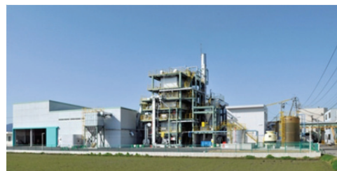
松阪木質バイオマス熱利用協同組合の熱供給設備