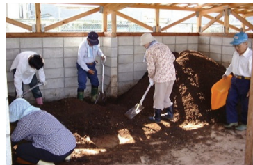
飯南町生ごみ堆肥化研究グループ