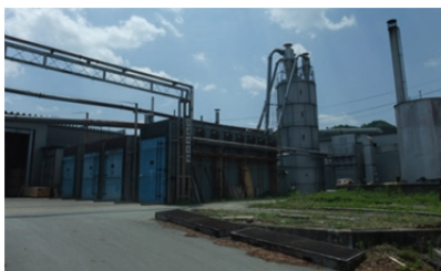
ウッドピア流通協同組合の熱利用設備

松阪木質バイオマス熱利用協同組合では、間伐材・林地残材・製材所端材を活用して隣接する辻製油株式会社、井村屋株式会社の2工場へ蒸気を販売しています。平成26年夏に完成する、うれし野アグリ株式会社の農業用ハウスへも温水を供給予定です。