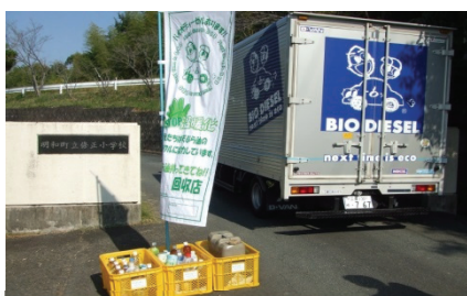
廃食用油回収拠点とBDF車

株式会社アンジェロでは、家庭や地域事業者からの廃食用油をバイオディーゼル燃料へ変換して、自社車両に使用するとともに原料との交換・販売を行っています。燃料の利用先には、自社及び個人利用者や生協などで車の軽油代替燃料として活用するほか、民間企業で自動車部品商品化の為の実証研究を行っています。